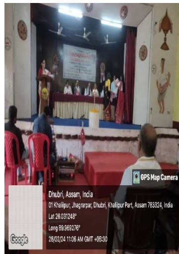
Dignitaries on the dais