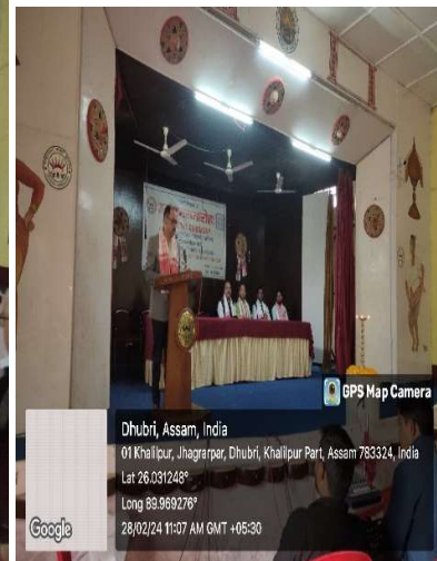
Principal, B. N. College delivering Welcome Address